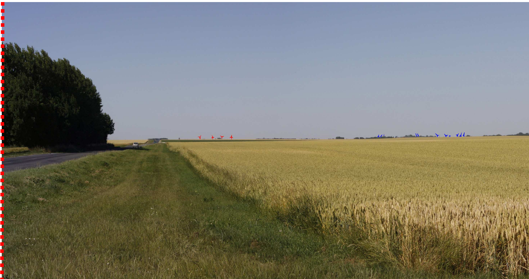
Photomontage d'interprétation recadré à 60°