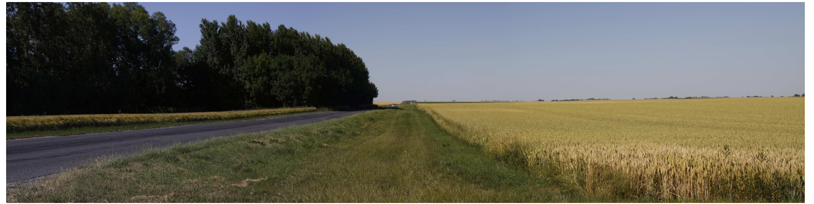
Le site actuel