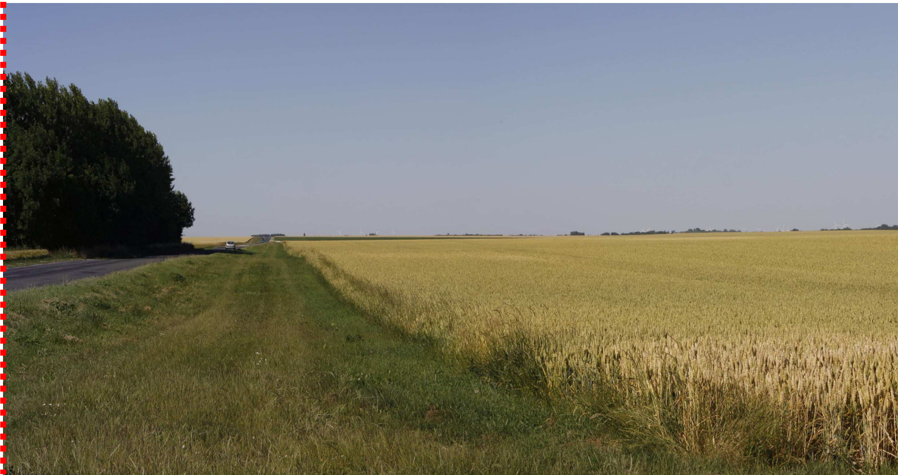
Photomontage recadré à 60°